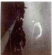
6:15 P.M. N. OF PHOENIX