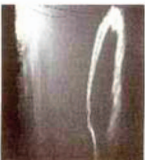
5:30 P.M. W.N.W. OF WINDLOW