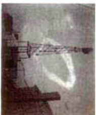
2:10 P.M. N.E. OF PRESCOTT

Having the appearance of a ring, a ring cloud is a rare phenomenon. It is a ring of clouds that is about 100 to 200 miles in diameter and is composed of many small clouds. The clouds are arranged in a ring around a central point, and they are often seen in the sky above a storm system. The clouds are often seen in the sky above a storm system, and they are often seen in the sky above a storm system.